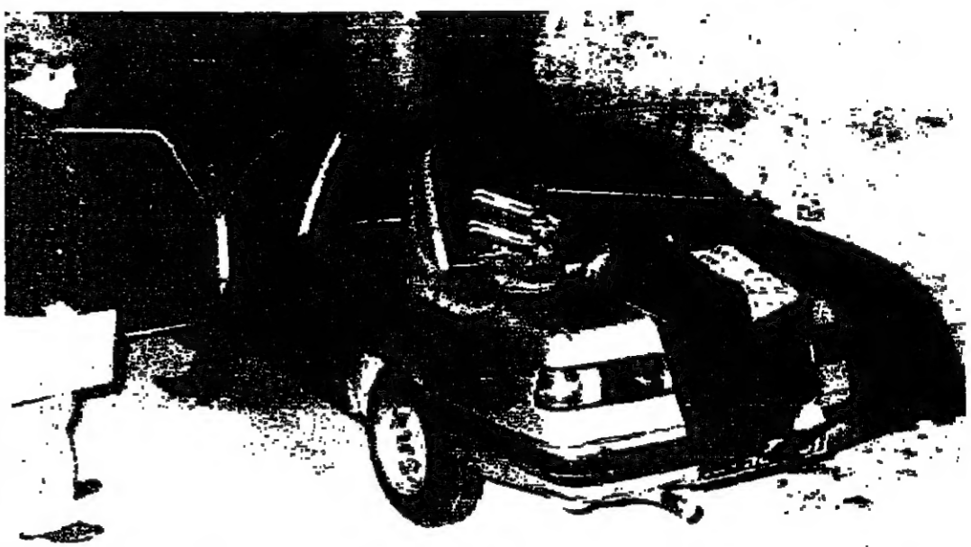
الخطف الدوق الايطالي سيسيليو غرازيولي مساء امس الاول من احدى ضواحي روما بينما كان داخل سيارته. وقد تلقى لواءه مخابرة من الخاطفين تطالب ب١٢ مليون دولار. وفي الصورة يسود رجلا البوليسي اثناء تقديم سيارته.